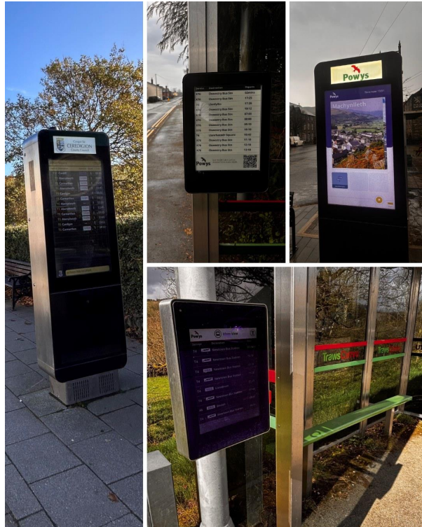
1 - Gwybodaeth bysiau amser real yn cael ei harddangos ar draws Ceredigion a Phowys.