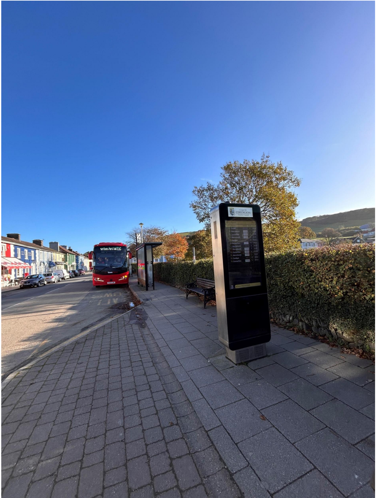
Cylchlythyr mis Ebrill Tyfu Canolbarth Cymru 2026