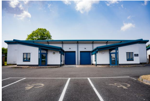
1 - Parc Busnes Horeb, Llandysul yng Ngheredigion

sydd gan y Ganolfan i'w gynnig yn genedlaethol ac yn rhanbarthol. Mae'r buddsoddiad hwn yn alinio ac yn ategu cynlluniau rhanbarthol eraill i yrru arloesedd bwyd yn ei flaen a rhoi hwb i'r economi leol."