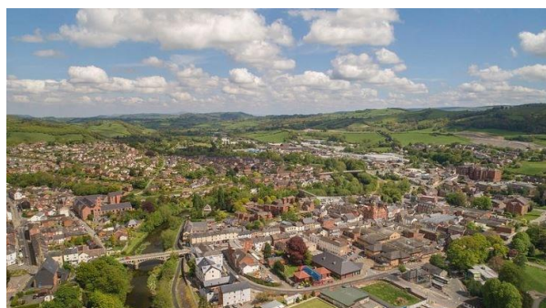
2 - Newtown, Powys

Dywedodd Mark Dacey, Prif Weithredwr Grŵp Colegau NPTC: "Mae'r coleg yn parhau i adeiladu'r sgiliau addysg bellach a'r sylfaen ddysgu mewn ardal ym Mhowys sydd eisoes yn gryf iawn ym maes gweithgynhyrchu uwch, gan ddarparu gwybodaeth a chefnogaeth dechnegol i'r gweithluoedd yn yr ardal. Mae datblygu'r safle hwn a darparu gofod masnachol mawr ei angen ar gyfer y sector hwn hefyd yn gyfle cyffrous i gysylltu cymuned fusnes sy'n tyfu â gweithgaredd darparu sgiliau'r coleg yn y dyfodol, o bosibl gyda ffocws ar dechnolegau cynaliadwy a fydd yn cefnogi nodau Sero Net y rhanbarth."