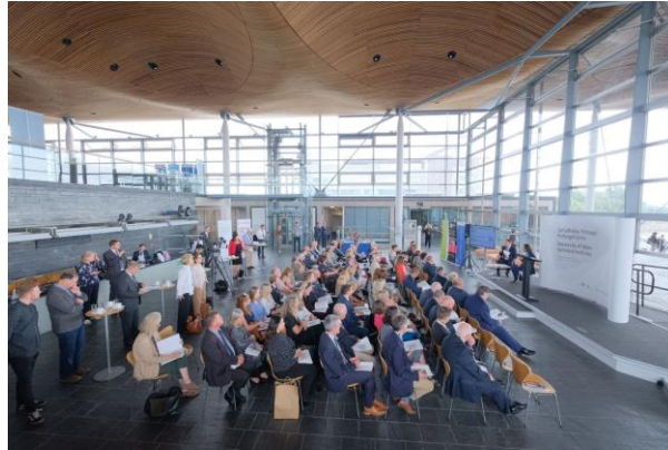
3 - Lansiad Sefydliadau Technegol Prifysgol Cymru yn y Senedd

Am fwy o wybodaeth ewch i wefan Prifysgol Cymru y Drindod Dewi Sant .