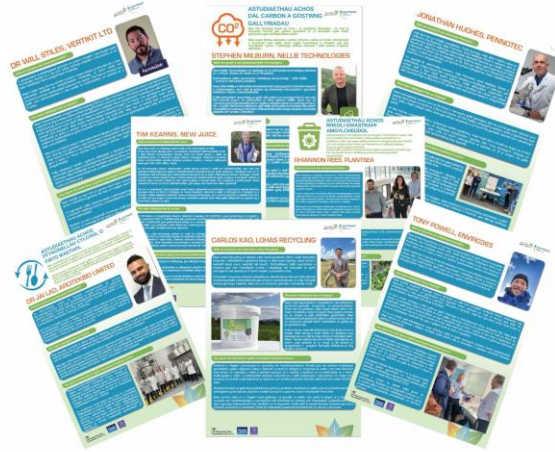
1 - Atudiaethau achos o gronfa Launchpad ArloesiAber