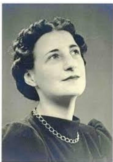
4 - Yr Athro F. Gwendolen Rees. Llundain: Prifysgol Aberystwyth

Swolegydd a pharasitolegydd o Gymru oedd Florence Gwendolen Rees, (3ydd Gorffennaf 1906 – 4ydd Hydref 1994), a fu, yn olynol, yn Ddarlithydd Cynorthwyol, Darlithydd, Uwch Ddarlithydd, Darllenydd, ac Athro ac a ddaeth yn Athro Emeritws yn 1973. Hi oedd y fenyw Cymreig cyntaf i ddod yn gymrawd y Gymdeithas Frenhinol a chafodd ei hethol hefyd yn Gymrawd y Sefydliad Bioleg. Bu'n Is-Lywydd a Llywydd Cymdeithas Parasitoleg Prydain ac fe gyhoeddodd 68 o bapurau ymchwil gwreiddiol, yn ogystal â hyfforddi llawer o fyfyrwyr.