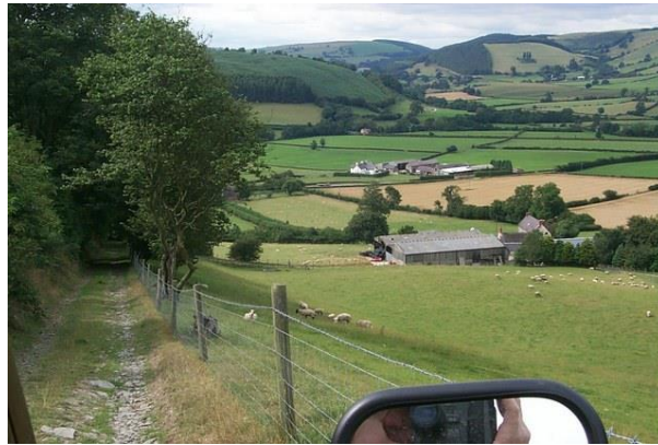
3 - Wedi'i geni a'i magu yn Sir Faesyfed

Gormod i'w sôn amdanynt! Yn gyffredinol, ymddangosiad a derbyn datblygiad economaidd rhanbarthol yng Nghymru – a Chanolbarth Cymru fel ei rhanbarth economaidd unigryw ei hun - yw'r datblygiad allweddol. O hynny, fe lifodd nifer o ddatblygiadau eraill - gan gynnwys Bargen Dwf y Canolbarth a Phartneriaeth Sgiliau Rhanbarthol Canolbarth Cymru (PSRh). Mae gweithio rhanbarthol wedi datblygu llawer yn ystod y saith mlynedd diwethaf, ac mae maint y gwaith rydyn ni nawr yn ei wneud fel Tyfu Canolbarth Cymru yn dyst i hynny.